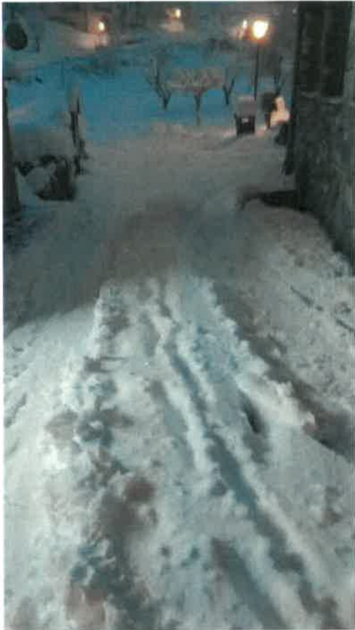
Seul le déneigement réalisé par les habitants, aucun engin passé