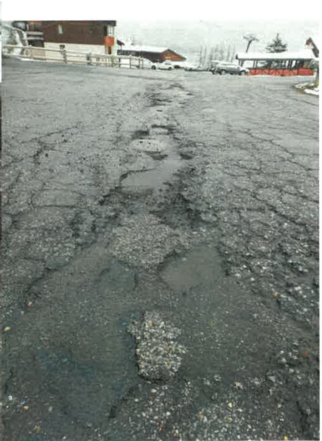
Voirie du côté Est, proche de la télécabine