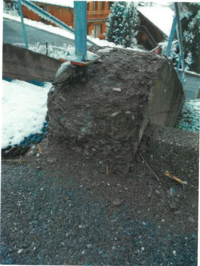
Base de main courante en avril 2023