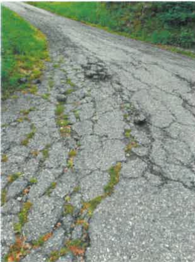
Voirie communale amont de Montorlin Eté 2023