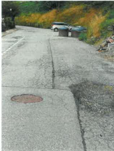
Plein centre du village Eté 2023