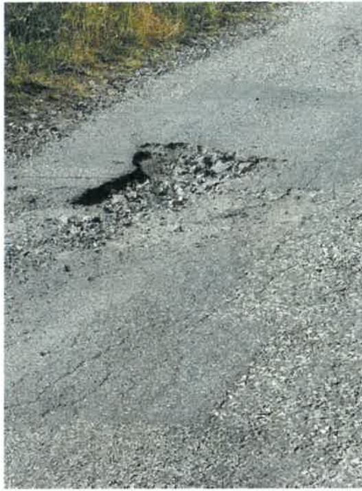
Route des Bauches