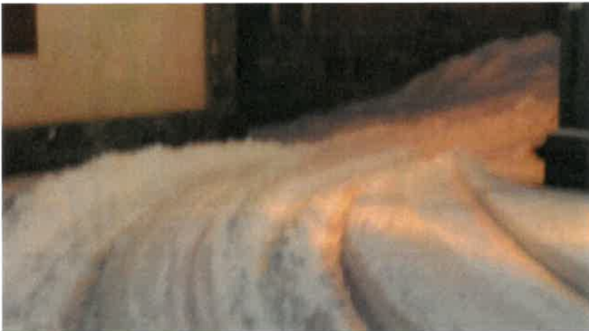
Route principale de Montchavin 7h45 du matin 8/12/2021, aucun engin n'est passé Trois malades en fin de vie au bout de cette voie, aucune notion sécuritaire et prioritaire