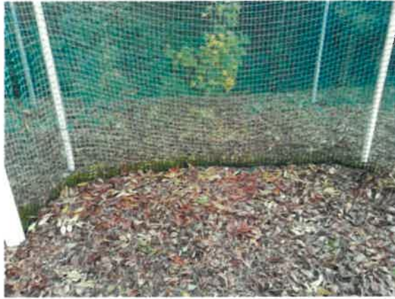
Terrain de sports sans entretien