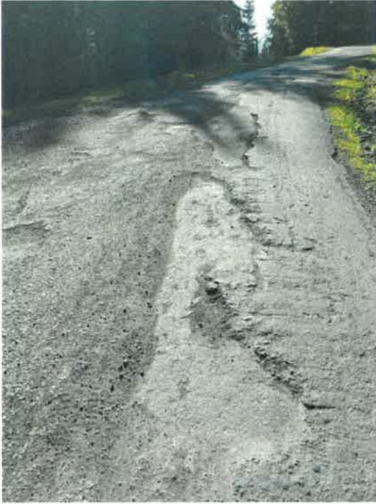
Route des Bauches