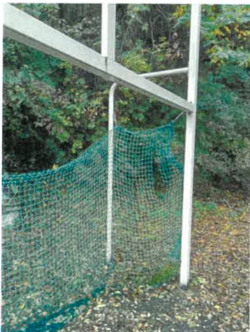
Filet déchiré laissé en l'état depuis des années