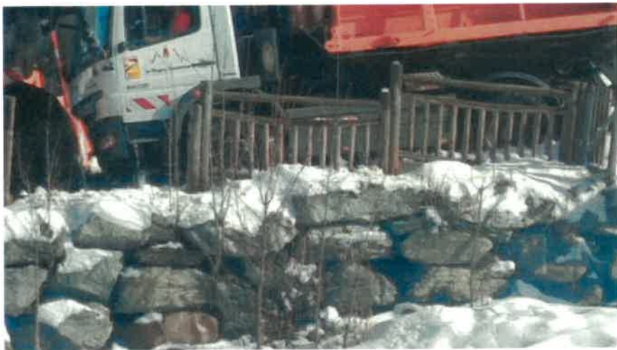
Barrière cassée tout l'hiver 2021/2022 devant la porte du camion communal Pourtant 2mètres de hauteur sur le chemin situé en plein centre du village La partie basse du mur en enrochement est l'arrivée des pistes des de Montchavin Les agents passent devant, l'état est resté ainsi plus de quatre mois sans sécurisation.