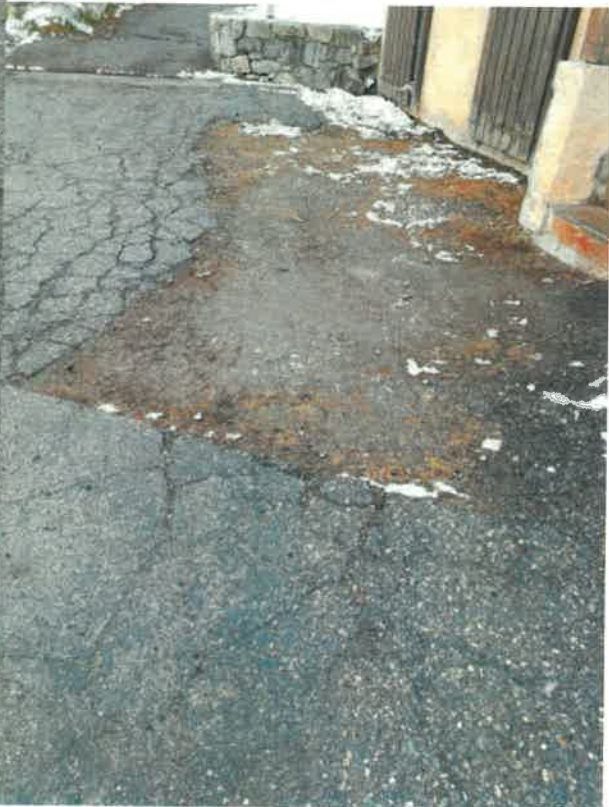
Absence de goudron et d'entretien 04/2023