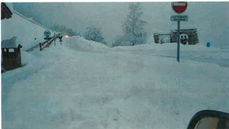
16h46 entrée du village, route départementale déneigée depuis le début du jour Entrée du village dans un état catastrophique