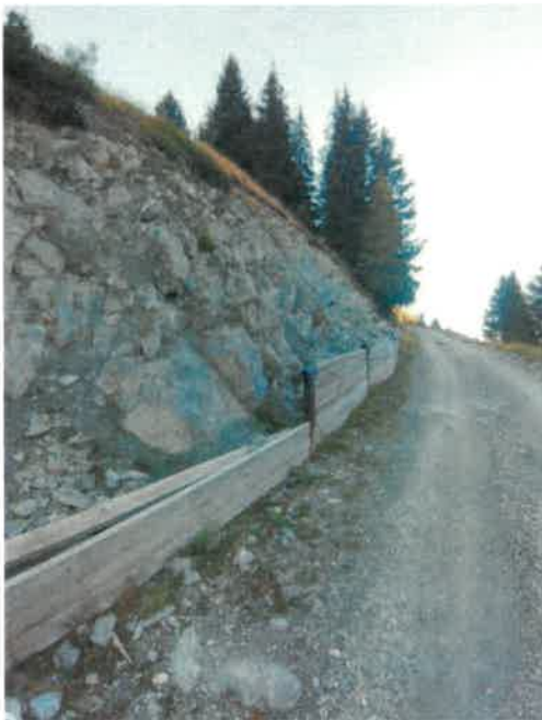
Protection des pierres en cours d'auto destruction

Bellentre possède des voiries de montagne permettant les accès estivaux aux remontées mécaniques, pour les forestiers, les agriculteurs, les bergers, les chasseurs et propriétaires de restaurants d'altitude.