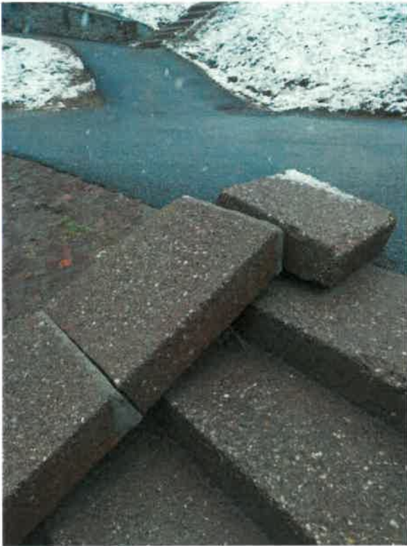
Place des carreaux centre commercial Laisse en l'état l'hiver