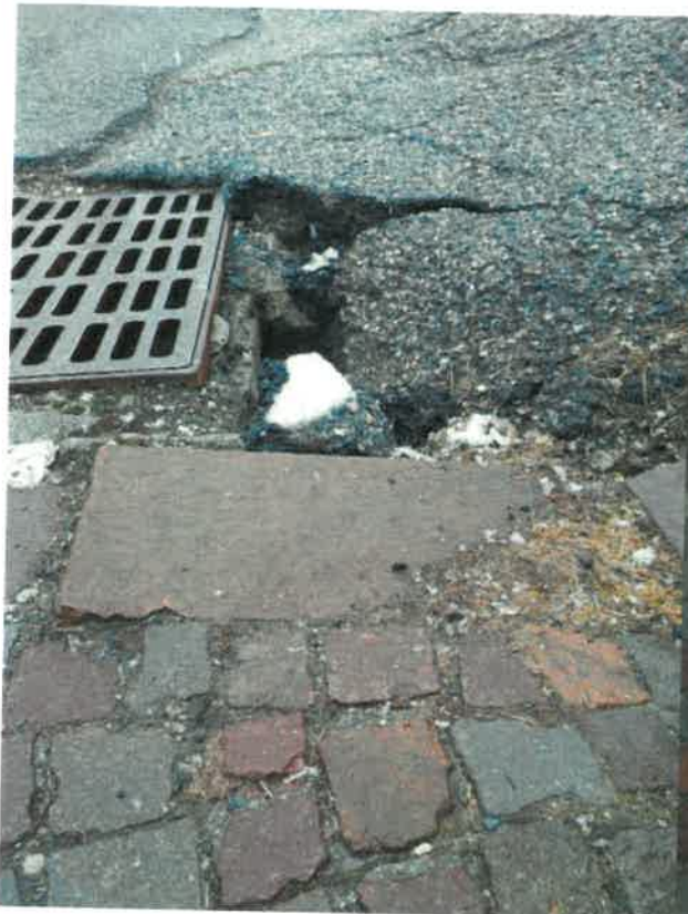
Plein centre de la station