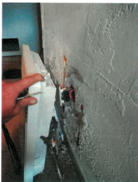
Infiltration d'eau sous sol salle Emprin Situation qui perdure depuis des mois