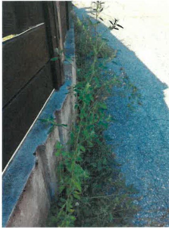
Entretien aucun de l'été 2023