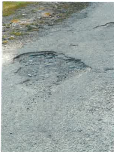
Route des Bauches