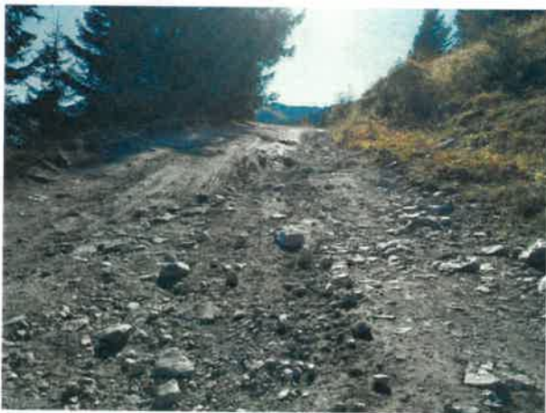
Route du Carroley