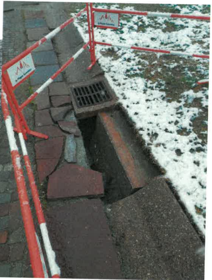
Trou béant protégé mais laissé en l'état presque tout l'hiver 2022/2023