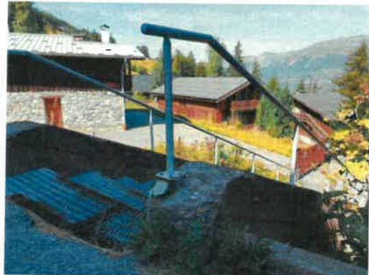
Même endroit en août 2023 soit quatre mois après