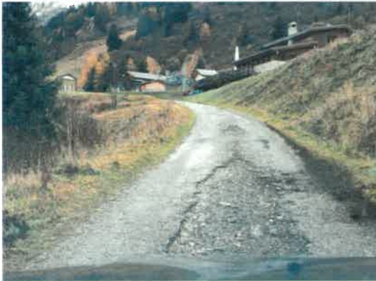
Route des Bauches

Le bitume est dans cet état tout le long La dégradation date depuis plusieurs années mais le budget alloué au goudron sur Bellentre, historiquement 400 000€ /an ne semble pas du tout respecté. La situation s'empire et quelques sont bouchés mais aucun tronçon n'est refait afin d'éviter une dégradation trop importante qui aura des conséquences très importantes.