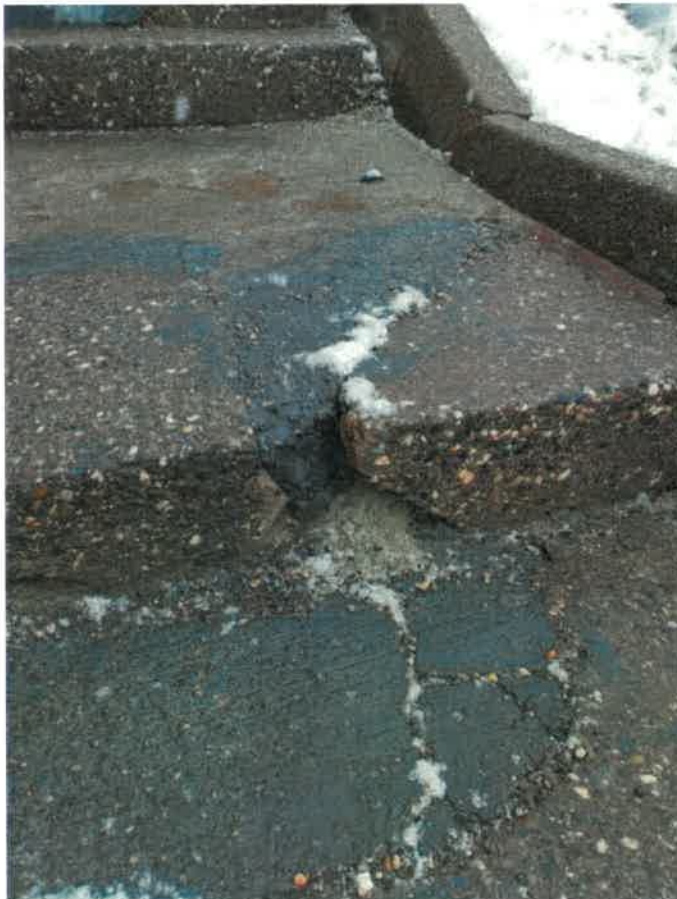
Marches d'escalier dans cet état depuis longtemps Mais la fusion n'a rien changé, aucun apport supplémentaire