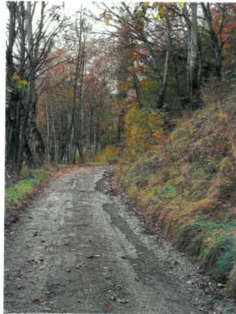
Route créée sur terrains privés avec accord verbaux Laisse en l'état de dégradation depuis des années