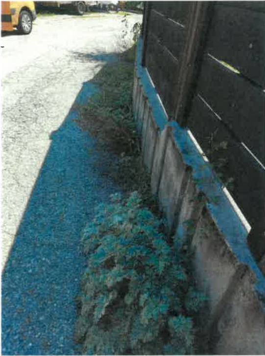
Entretien aucun de l'été 2023