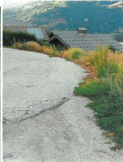
Amont lotissement entretien des espaces Eté 2023