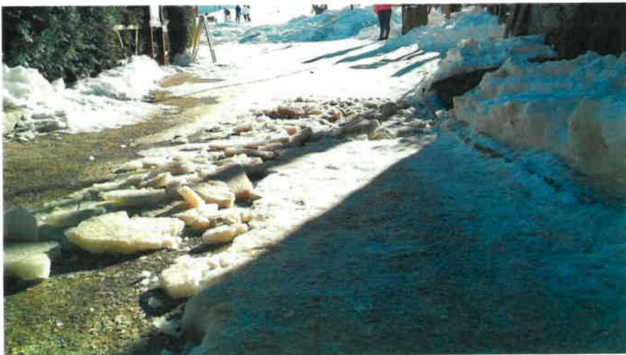
Station de ski ouverte, déglacage de la rue faite par des habitants La service ne s'est pas amélioré, il a nettement reculé