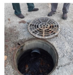
Rejets effluents viticoles dans les eaux pluviales

- 38 dont les origines sont difficilement identifiables ; Et qui font l'objet d'investigations complémentaires pour en déterminer l'origine