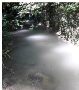
Rejets de MES

Les différents éléments du tableau de suivi permettent d'extraire un ou plusieurs événements et d'établir des statistiques suivantes pour 2020 :