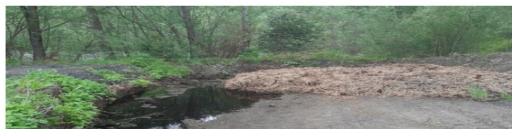
Stockage de fumier à proximité d'un cours d'eau