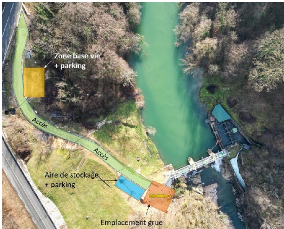
Implantation des installations de chantier et accès