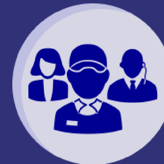
Métier & Association