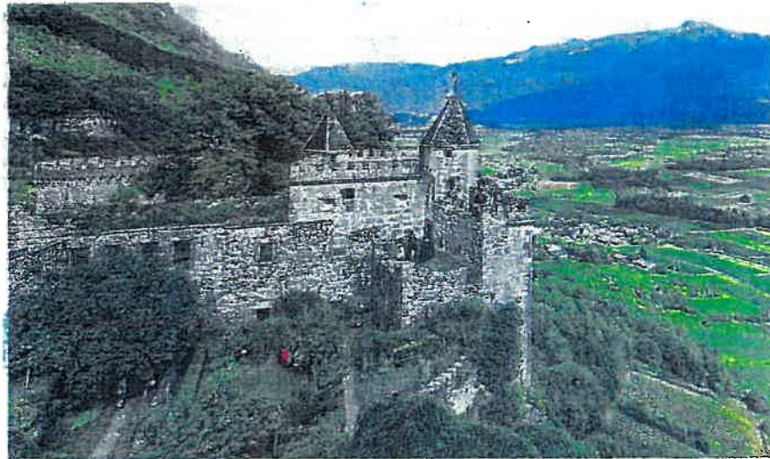
Incontournable comme les châteaux savoyards, insolite comme un abri anti-aérien ou pittoresque sur les traces d'un ancien train à crémaillère, le choix est riche pour les Journées du patrimoine ce week-end.